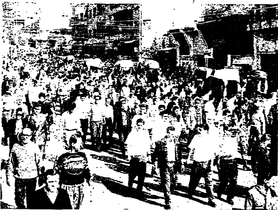
موكب المجازة يخترق شوارع الحدث (بشارة الشايب)